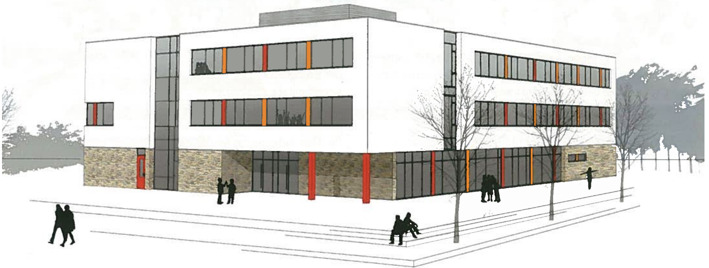
3 Das neue Grundschulgebäude Bad Bentheim – durch die funktionale Ausschreibung konnten

Der Bauherr stand vor der Entscheidung, in vier Gebäuden Kesselanlagen zu sanieren und zusätzlich die Wärmeversorgung für einen Neubau zu sichern. Alle Gebäude standen in einem mittelbaren räumlichen Zusammenhang. Mit der Entscheidung, für diese Aufgabe das Modell des Wärmecontracting zu wählen, hat der Bauherr genau die richtige Wahl getroffen.